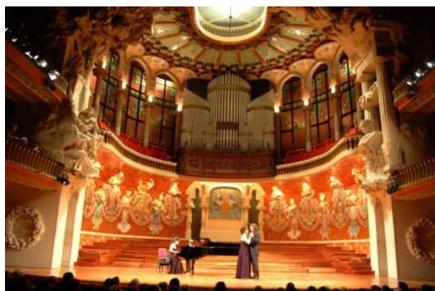
Concierto posterior a la entrega de premios y certificados